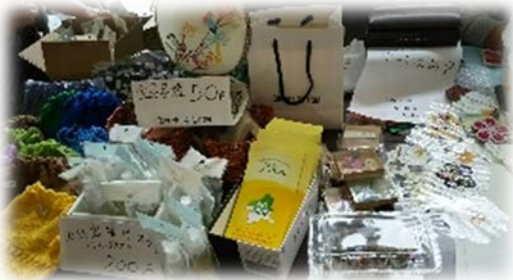
9月3日 こころのふれあいバザー展 今年も県庁のバザー展に出展しました。