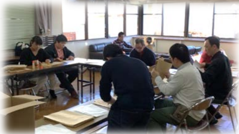
11月13日 スプラウト倶楽部 皆で講習会のチラシ400通の発送作業をしました！