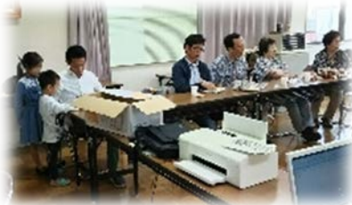
10月9日: スプラウト倶楽部 12月のクリスマス会の企画会議でした。